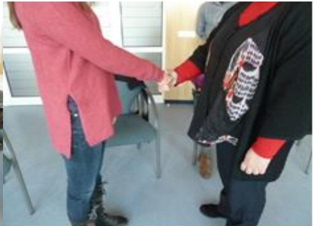
Negoci amb amiga